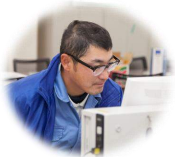
浜田ビルメンテナンス（株）