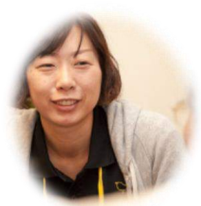
（有）高村 高齢者生活支援住宅 サンガーデン輝らら